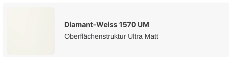
Diamant-Weiss 1570 UM Oberflächenstruktur Ultra Matt