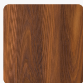
Yosemite S016 YS Oberflächenstruktur Yosemite