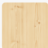
Astfichte 3396 AN Oberflächenstruktur Authentic Nature