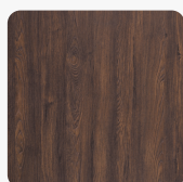
Makalo Teak K4342 AW Oberflächenstruktur Authentic Wood