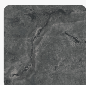
Atlantic Stone Steel K4896 DP Oberflächenstruktur Deep Painted