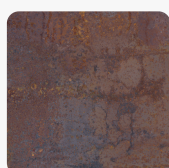
Rusty Iron K4398 DP Oberflächenstruktur Deep Painted