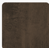
Oxid Dark Brown K5579 DP Oberflächenstruktur Deep Painted