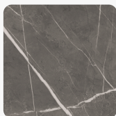
Pietra Grey K4892 DP Oberflächenstruktur Deep Painted