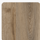
Eiche Salzburg Modern K5282 AN Oberflächenstruktur Authentic Nature