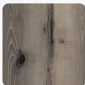
Linde Malvo Dawn K4948 AN Oberflächenstruktur Authentic Nature