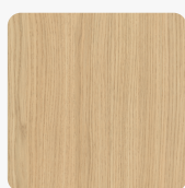
Vicenza Eiche H3157 ST12 Oberflächenstruktur Ompipore Matt