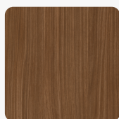
Lincoln Nussbaum H1714 ST19 Oberflächenstruktur Deepskin Excellent