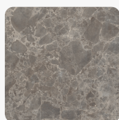
Siena Marmor grau F095 ST87 Oberflächenstruktur Mineral Ceramic