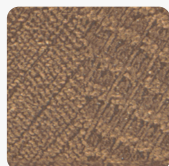
Halifax Eiche Zinn Q3176 RO