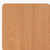
Buche 3381 PR Oberflächenstruktur Pore rustikal