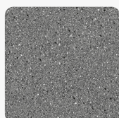
Granito anthrazit 4288 PE Oberflächenstruktur Perl