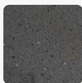
Lava Rock AA

mehr Informationen http://www.frischeis.at/shop/platte/mineralwerkstoffplatte--becken/mineralwerkstoffplatte/dupont-corian-mineralplatte-lava-rock-aa-p59487