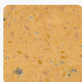
Aztec Gold GD

mehr Informationen http://www.frischeis.at/shop/platte/mineralwerkstoffplatte--becken/mineralwerkstoffplatte/duPont-corian-mineralplatte-aztec-gold-gd-p58971