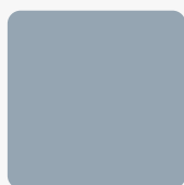
Denimblau U540 ST9 Oberflächenstruktur Smoothtouch Matt