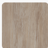
Amazon 37746 AT Oberflächenstruktur Authentic Touch