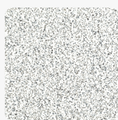
Domino Terrazzo DMN