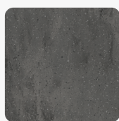
Carbon Aggregate CXA