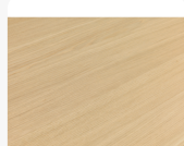
Eiche schlicht, Brettoptik Oberflächenstruktur Furnier