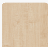
Ahorn 1307 BF Oberflächenstruktur Büromöbeloberfläche