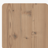
Lärche natur 1353 ST Oberflächenstruktur Struktur