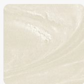
Nimbus Prima NP

mehr Informationen http://www.frischeis.at/shop/platte/mineralwerkstoffplatte--becken/mineralwerkstoffplatte/duPont-corian-mineralplatte-nimbus-prima-np-p3429270