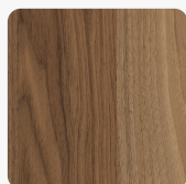
Cello Nussbaum 0811 NA Oberflächenstruktur Natura