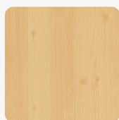
Astfichte 0175 NA Oberflächenstruktur Natura