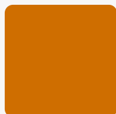
Sienaorange U350 ST9 Oberflächenstruktur Smoothtouch Matt