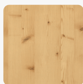
Astfichte natur H3470 ST22 Oberflächenstruktur Deepskin Linear