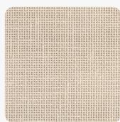
Leinen Beige F425 ST10 Oberflächenstruktur Deepskin Rough