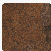
Ceramic Rusty F310 ST87 Oberflächenstruktur Mineral Ceramic