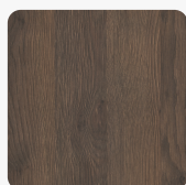
Gladstone Eiche tabak H3325 ST28 Oberflächenstruktur Feelwood Nature