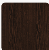
Wenge Gondou 37710 BS Oberflächenstruktur Office Structure