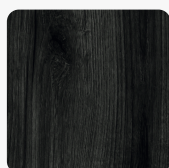
Eiche Evoke Infinity K2349 IR Oberflächenstruktur Evoke