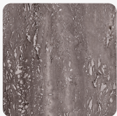
Travertin Toscana K2780 CN Oberflächenstruktur Ceramic Nature