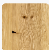
DIAMANT Fichte Altholz Oberflächenstruktur Furnier