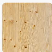
DIAMANT Fichte astig Oberflächenstruktur Furnier