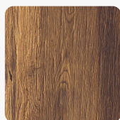
DIAMANT Eiche Altausee Oberflächenstruktur Furnier