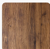
DIAMANT 2.0 Eiche Altausee Oberflächenstruktur Furnier