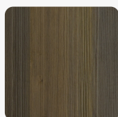
STRUKTURDECKLGE Eiche Schwarzensee Oberflächenstruktur Furnier