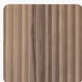
FLOW Nuss amerikanisch Oberflächenstruktur Furnier