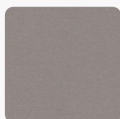
Oxford 3405 TE Oberflächenstruktur Texta