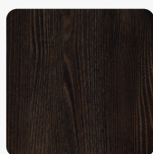
Thermo Eiche schwarzbraun H1199 ST12 Oberflächenstruktur Omnipore Matt