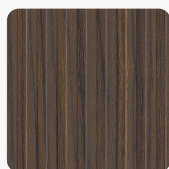
Riga LS53 Oberflächenstruktur Riga