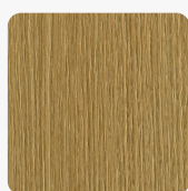
Quercia S203 QE Oberflächenstruktur Quercia