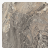
Cipollino Marmor grau F093 ST7 Oberflächenstruktur Smoothtouch Fine Pearl