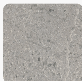
Candela Marmor hellgrau F243 ST76 Oberflächenstruktur Mineral Rough Matt