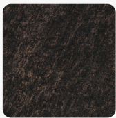
Cupria Slate F237 ST76 Oberflächenstruktur Mineral Rough Matt