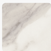
Kristallmarmor F800 ST9 Oberflächenstruktur Smoothtouch Matt