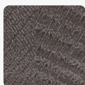
Sherman Eiche anthrazit Q1346 RO